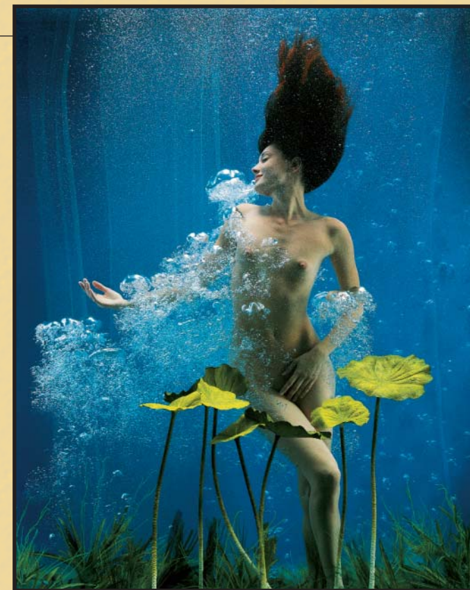
... and then there is the water, a great element of inspiration, that attracts me as the call of the forest...

Spesso emerge nelle fotografie il voluto contrasto tra artificio e natura teso ad aggiungere una nuova percezione della realtà che trasporta oggetti quotidiani in situazioni irreali". ■